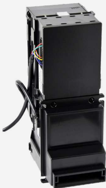
Lett.V7 vert con stk 200 34 v MDB c. cavo