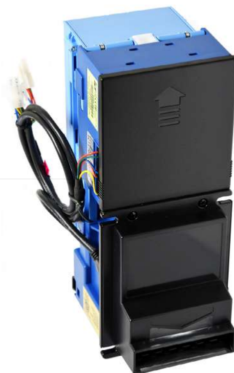
Lett. XBA stk 400 Mdb c. cavo